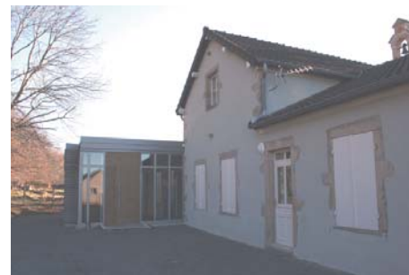
▲ Vue, depuis l'espace extérieur au nord, sur l'extension du bâtiment et sur l'ancienne école

Une extension prolonge le bâtiment sur l'arrière. Sobre et revêtue d'un bardage bois, elle se différencie ainsi de la construction existante. Les menuiseries en aluminium tranchent également avec celles en bois du bâtiment existant.