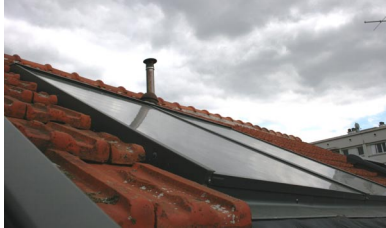
Les capteurs sur le toit de la copropriété

Une régulation électronique actionne la pompe de circulation du fluide, lorsque la température est plus élevée dans les capteurs qu'à l'intérieur du ballon. Un vase d'expansion est prévu pour le fluide caloporteur afin d'éviter, l'été, de trop fortes pressions à l'intérieur du circuit.