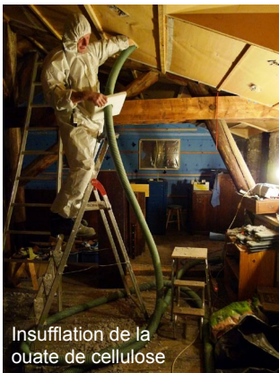
Insufflation de la ouate de cellulose

La dernière étape du projet consiste à aménager les combles pour y installer de nouvelles chambres, une salle de bain et des toilettes. Les combles de ce logement, comme dans la plupart des bâtiments n'étaient pas conçus pour être aménagés. Les ouvertures, la distribution, l'isolation et l'électricité sont à créer.