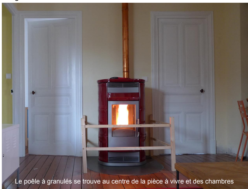
Le poêle à granulés se trouve au centre de la pièce à vivre et des chambres

Pour répondre à ces objectifs en tenant un budget raisonnable, le projet se déroule étape par étape. Dans un premier temps, ils ont commencé par le 2 ème étage : changement de cloisons pour des espaces intérieurs plus adaptés et une meilleure distribution des pièces. Ensuite, ils ont remplacé les fenêtres par des menuiseries à double-vitrage performant, et peint les murs avec des matériaux écologiques et perspirants, installé le chauffage, l'eau chaude. Enfin, ils aménagent les combles.