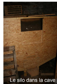
Le silo dans la cave

Le poêle à granulés a été choisi pour sa puissance de 12 kW. Il est composé d'un réservoir de stockage de 29 kg, ce qui lui confère une autonomie maximale de 32 heures en fonctionnement continu. Le propriétaire a construit un silo de granulés de 2 tonnes dans sa cave. Cela lui permet de commander des granulés en grande quantité, en vrac, et de s'affranchir ainsi du coût de conditionnement du granulé en sac. Ainsi, une fois par jour en plein hiver, ils descendent chercher leur combustible à la cave.