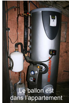
Le ballon est dans l'appartement