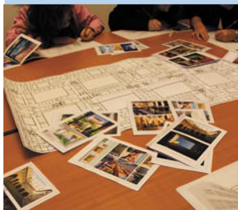
atelier pratique, dessin en perspective