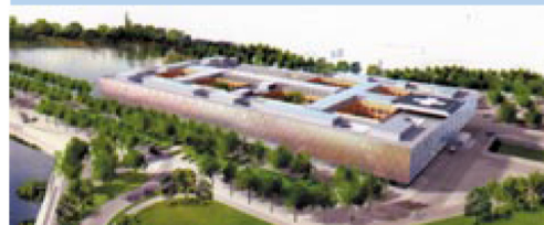
nouvel hôpital du chalonnais