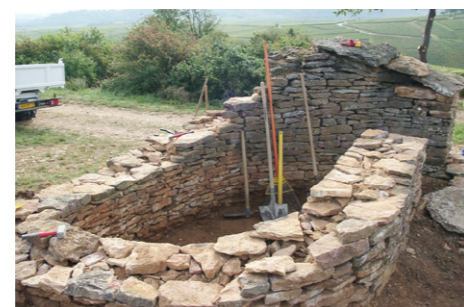
Chantier de restauration d'une cadole (près de Solutré).

« Le petit patrimoine représente nos racines. En 2011, il doit insuffler autre chose. Avec du bon sens et un peu de réflexion, sans rester bloqué sur le passé, nous pouvons actuellement travailler différemment. Les néo-ruraux ont besoin de s'approprier le territoire où ils se trouvent. Ils ont besoin de connaissance, sont prêts à s'investir ; ceux qui reviennent aussi, ils font des recherches, des études sur ce qu'ils ont vu étant enfant, ils débroussaillent pour retrouver de vieilles fontaines. Parallèlement, les associations sont très actives. »