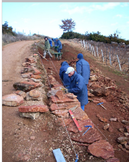
Mur de soutènement d'un chemin, en pierres sèches sur le sentier d'accès au sommet de la Roche.