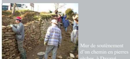
Mur de soutènement d'un chemin en pierres sèches, à Davayé.