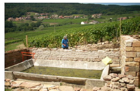
Restauration d'un lavoir à Vergisson.

« C'est l'identité locale, notre histoire. Ce sont les enfants qui dépierraient les sols. Connaître le petit patrimoine, c'est découvrir le travail et la vie des hommes. L'homme a façonné le territoire avec les matériaux trouvés sur place et les contraintes du site. On retrouve sur des cadastres napoléoniens des moulins aujourd'hui disparus. Les lavoirs, très nombreux étaient construits sur chaque petite rivière. La gestion des eaux était assurée par les aménagements de l'homme dans le paysage, aujourd'hui cette gestion se fait parfois avec des revêtements en béton ! »