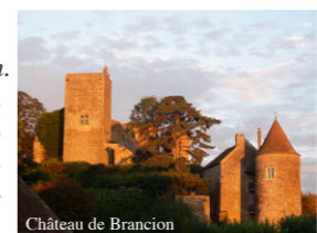
Château de Brancion

Économie, culture, lien social : des volontés politiques très souvent affichées et que l'on peut vivre au quotidien grâce au patrimoine et à sa conservation. »