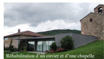
Rehabilitation d'un cuvier et d'une chapelle