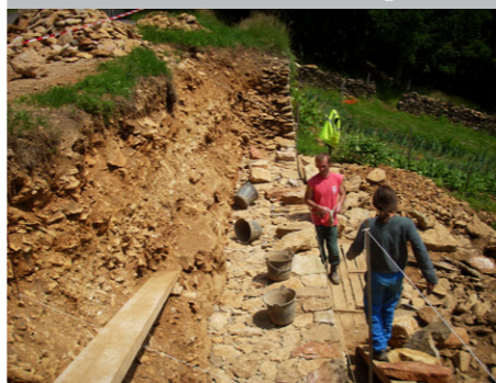
Mur de soutènement d'une route, en pierres sèches à Lournand

Ci-dessous, différentes interventions de la brigade verte :