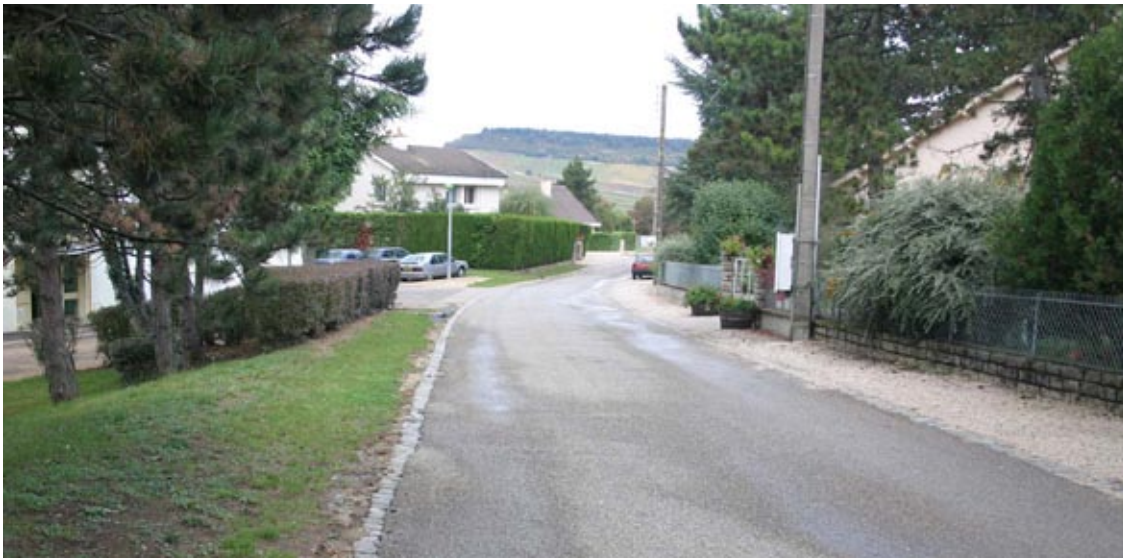
Le profil de la rue est traité dans le même esprit que dans le village.