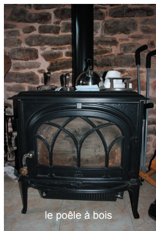
le poêle à bois