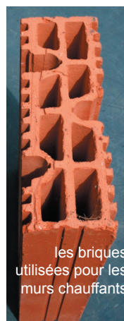
les briques utilisées pour les murs chauffants