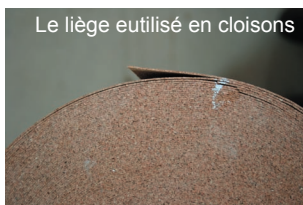
Le liège utilisé en cloisons

Toutes les cloisons sont identiques : une ossature en lambourdes de bois de 4 cm remplie de panneaux de fibre de bois, recouverte de part et d'autre par une couche de liège de 2mm et des plaques de gypse et cellulose. Toutes ces cloisons sont posées sur une fine couche de fibre de bois pour réduire la transmission des bruits dans ces cloisons.