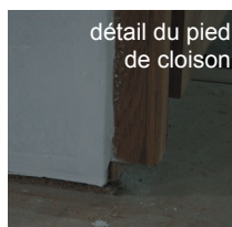
détail du pied de cloison