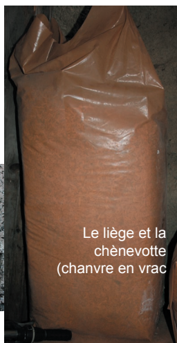
Le liège et la chènevotte (chanvre en vrac)

de 400 kWh/m 2 *an) consommation de gaz : 800 € (abonnement et eau chaude sanitaire compris)