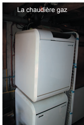
La chaudière gaz

Dans la partie ancienne, les radiateurs sont équipés de robinets thermostatiques, et deux thermostats d'ambiance permettent de déclencher la chaudière