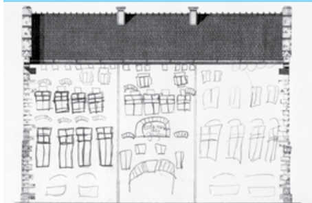
dessin de façade et de détails constructifs

La maison d'école (03 85 57 29 36) propose un droit d'entrée de 0,50 € par élève.