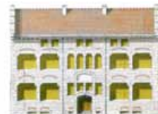
Exposition DULAC et l'architecture scolaire maison d'école - Montceau-les-Mines Écomusée Creusot-Montceau

Le CAUE fournit des « livrets à annoter » pour les élèves et le reste du matériel nécessaire aux ateliers.