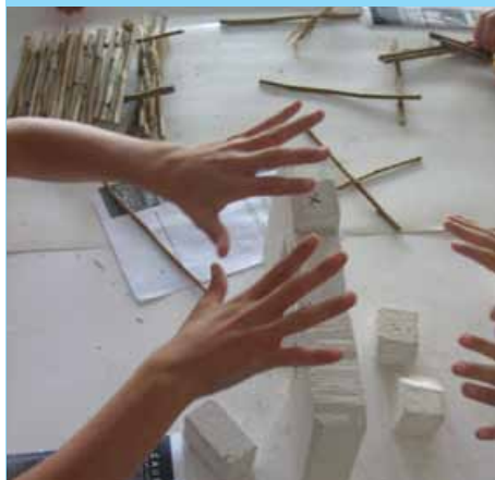
ateliers en classe, manipulation de matériaux