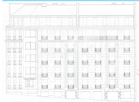
façade de l'immeuble rempart St Pierre 1931 - L. Chaumy et J.L. Bultel architectes