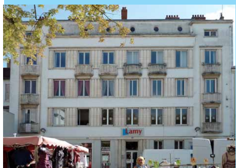
photographie de l'immeuble Dodille 1933 - Maurice Gremeret architecte