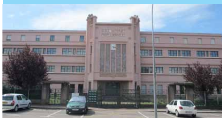
ENP - Lycée Niepce 1937 - G. Tronchet architecte