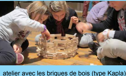
atelier avec les briques de bois (type Kapla)

À l'occasion du mois de l'architecture contemporaine en Bourgogne et de l'inauguration de travaux d'extension, la Maison du Terroir de Genouilly organise différentes actions liées à l'architecture et au bois, notamment avec l'école communale. Le CAUE propose d'animer ces ateliers de sensibilisation à partir des outils pédagogiques de la Galerie Européenne du Bois et de la Forêt (Dompierre-les-Ormes).