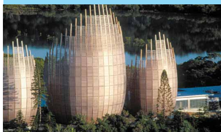
Centre culturel Jean-Marie Tjibaou à Nouméa Renzo Piano architecte