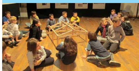
atelier avec les mini-charpentes