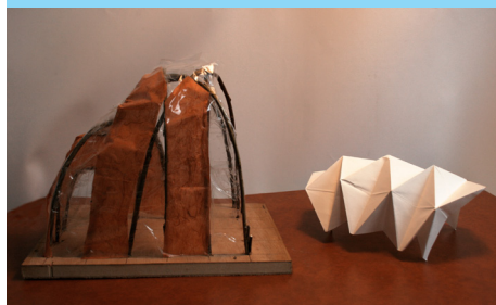
Lumière, matière et structure en maquette

Les CAUE sont des associations départementales mises en place par la loi sur l'Architecture de 1977. Assumant des missions de service public, leur objet est de promouvoir la qualité de l'architecture, de l'urbanisme et du cadre de vie.