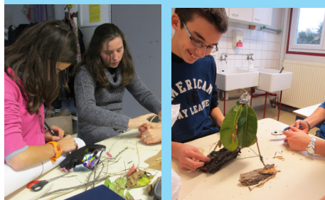
Les élèves expérimentent la stabilité de leur construction