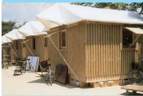
Paper House - Shigeru Ban architecte