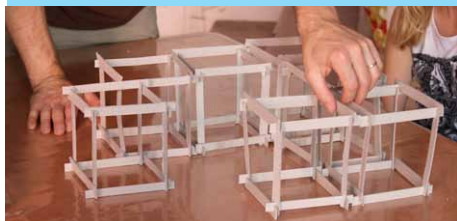
Atelier maquette grand format (3 module)