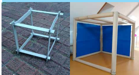
Atelier maquette petit et grand format (1 module)