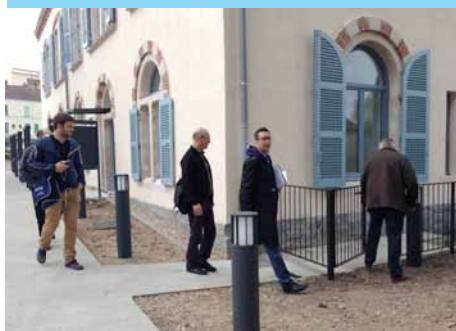
Visite du CAUE 71 ancien immeuble réhabilité