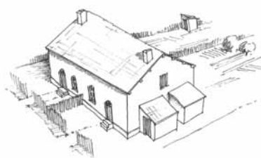
Parcours dans Montceau évolution de l'habitat