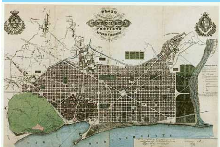
Plan Cerdà, 1860