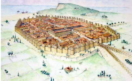
Barcino, colonie Romaine