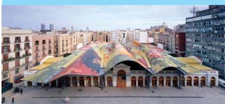
Marché Santa Caterina, 2004 Enric Miralles & Tagliabue architectes

À l'occasion du Mois de l'architecture contemporaine en Bourgogne, le collège Roger Vaillant de Sanvignes souhaite faire intervenir le CAUE de Saône-et-Loire afin de sensibiliser les élèves à l'architecture contemporaine et au modernisme à Barcelone. L'intervention permettra de préparer les élèves à la découverte de Barcelone lors d'un voyage d'étude qu'ils effectueront en 2015.