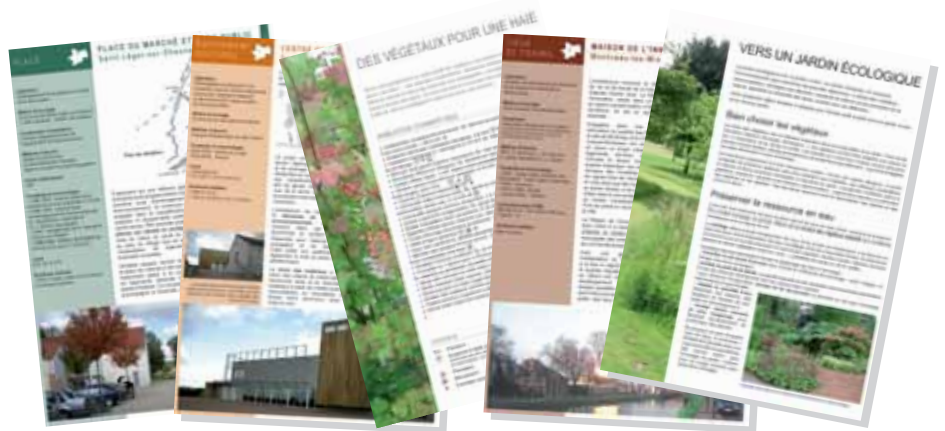
Petit aperçu des fiches de conseils et des fiches de références

Il faut se sentir concerné par l'endroit où l'on vit. Chacun peut regarder par la fenêtre et chausser ses bottes pour se promener. Si l'on demeure dans un endroit, c'est certainement parce qu'on a été séduit par son identité, la vie et ses paysages. Un regard attentif sur le paysage permet de mieux le comprendre et de le faire évoluer positivement.