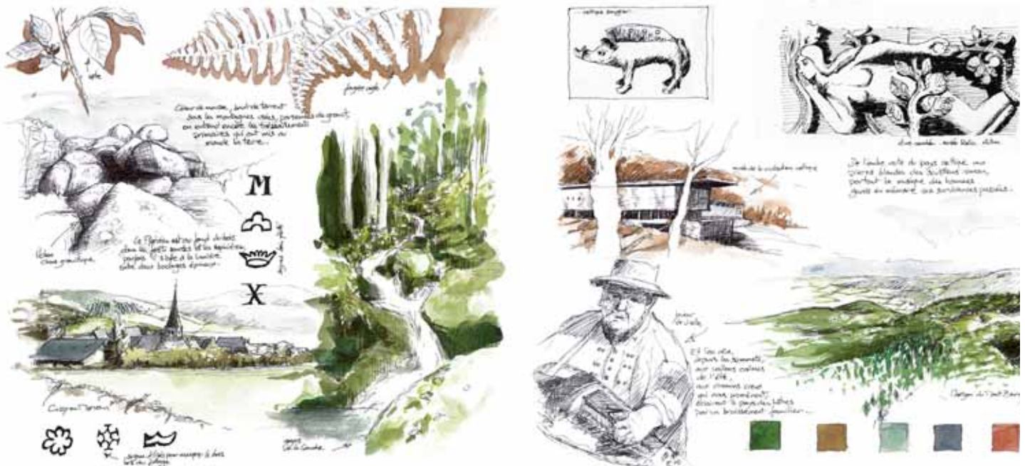
Les illustrations de ce dossier sont extraites de l'ouvrage "Paysages de Saône-et-Loire" - Photographies noir et blanc de Patrice Thomas.