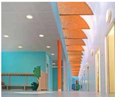
Centre de loisirs à Torcy - M. Dauber, arch.