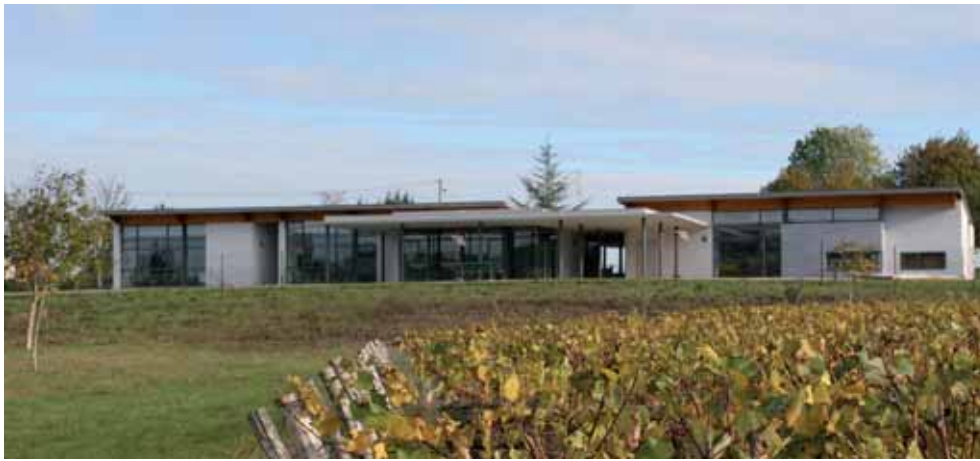
Groupe scolaire Jules-Verne à Saint-Boil - H. Regnault, arch.