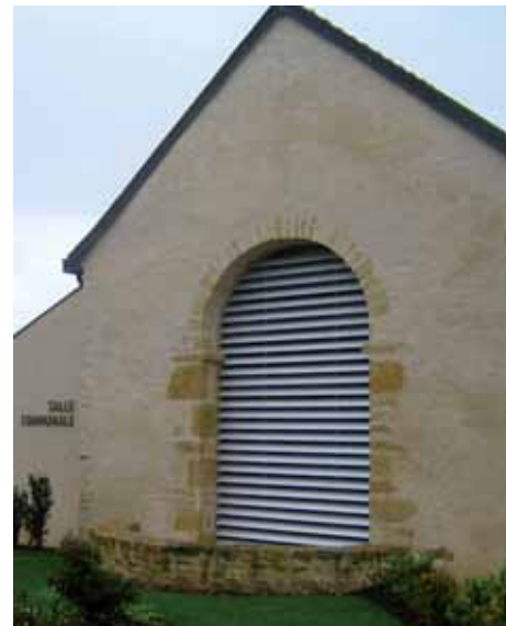
Salle communale de Nochize - G. Setan, arch.

L'esprit d'économie générale est primordiale dès les premières phases d'investissement intellectuel.