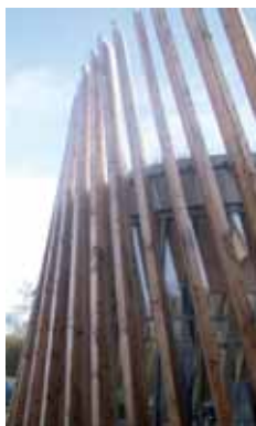
Garderie périscolaire à Mervans - P. Barbier, arch.