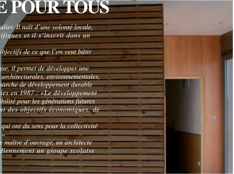
Salle communale de Fragny (Autun) - I. Sénéchal-Chevallier et E. Auclair, arch.

Quelques pistes nous sont données par différents acteurs : un maire maître d'ouvrage, un architecte maître d'œuvre et une directrice-enseignante utilisant quotidiennement un groupe scolaire intercommunal.