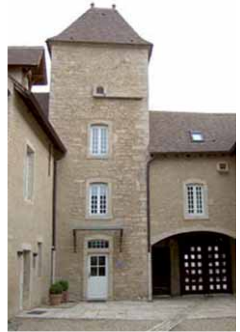
Mairie, logements, salles communales à Laives F. Faucher, arch.