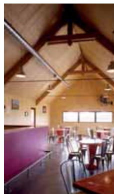
Vestiaires sportifs à Mercurey C. H. Tachon, arch.