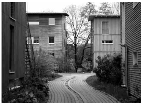
Éco-quartier à Freiburg (Allemagne)