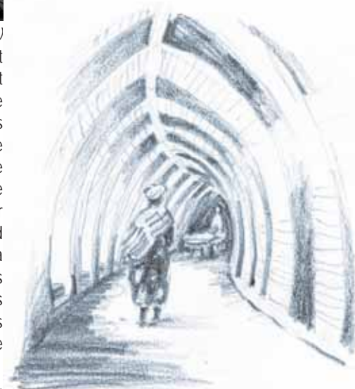
Hôpital de Kaédi (Mauritanie) 1984 - Fabrizio Carola architecte

Et si vous avez besoin de conseils, le CAUE de Saône-et-Loire peut vous aider !