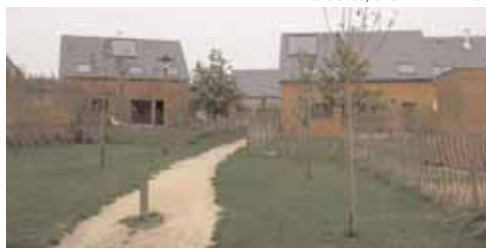
Lotissement à Langouët.

Composition urbaine des plans masse et des limites parcellaires, traitement des espaces collectifs et de la structure paysagère. Implantation des constructions et du bâti annexe. Utilisations de matériaux écologiques.