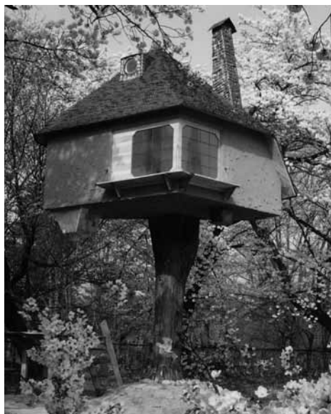
Pavillon de thé (Japon) 2004 - Terunobu Fujimori architecte