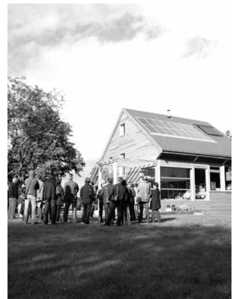
Visite d'une maison individuelle dans la région de Chagny

Grâce aux fiches de référence et aux livrets de visite réalisés en 2009, vous pouvez, entre autres, obtenir des informations concernant : des maisons bioclimatiques implantées dans le Chalonnois, le Clunisois, le Tournugeois, la région de Chagny et le bassin minier ; la réalisation des espaces publics du bourg médiéval de Brancion ; et des équipements publics à Torcy (Maison de la petite enfance, centre de loisirs et Maison des familles).