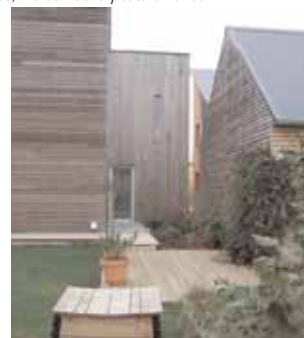
Lotissement à Bazouges-sous-Hédé.

Amélioration des bâtiments existants, concilier performance énergétique et qualité architecturale.