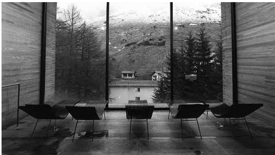
Thermes de Vals (Suisse) 1996 - Peter Zumtor architecte

Si vous souhaitez organiser d'autres manifestations sur le thème de la santé et de l'architecture, n'hésitez pas à nous contacter.