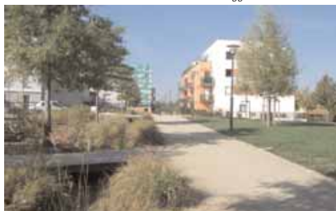
Quartier Beauregard à Rennes

Composition urbaine autour d'un vaste parc et d'une structure bocagère organisant les modes de transport doux et l'implantation des immeubles collectifs et des équipements publics.