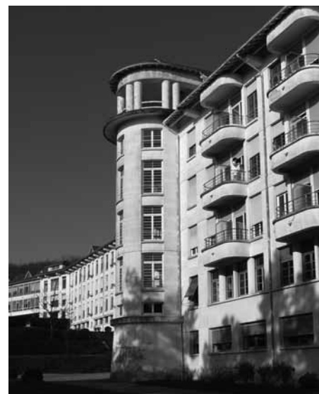
Sanatorium de Bergesserin (Saône-et-Loire) 1932-39 / 1946 F. Bidaut architecte