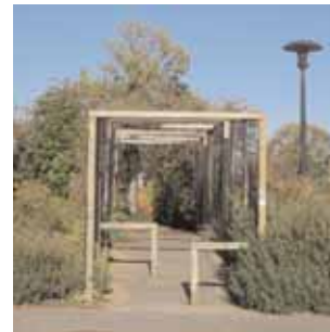
Quartier de la Timonière à Acigné