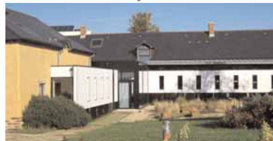
Mordelles, maison de la petite enfance.