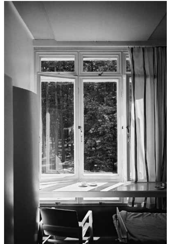
Sanatorium de Paimio (Finlande) 1928-1933 - Alvar Aalto architecte