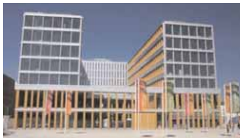
Hôtel d'agglomération à Rennes

Discussions autour des outils réglementaires (SCOT, PLH...) et de l'accompagnement humain et financier proposé par Rennes Métropole aux communes du Pays de Rennes.