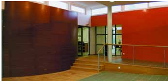
Transparence dans le hall d'accueil