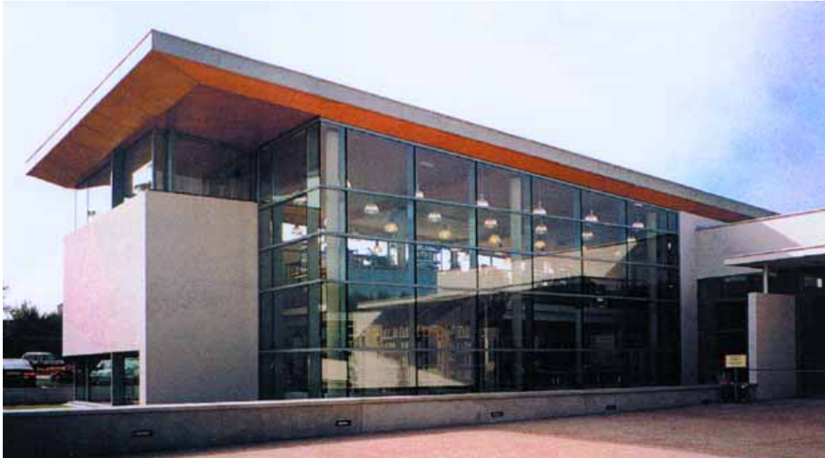
Extérieur de la bibliothèque

Bibliothèque - centre de loisirs - espace jeunes et espace de rencontre