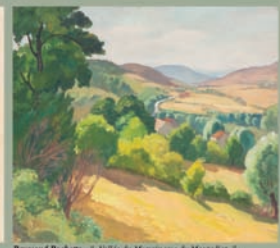
Raymond Richetto - "Vallée du Merwin vue du Montaillet"