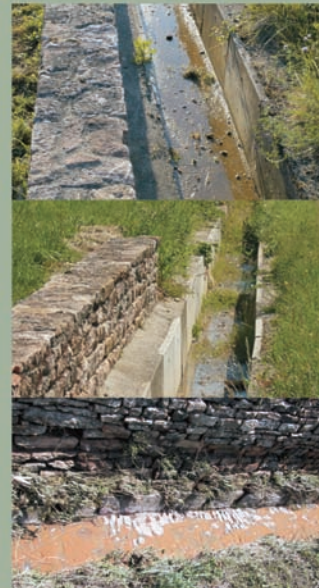
Fossés bétonnés, fossés pavés.

Les bandes enherbées D'autres solutions plus écologiques sont parfois utilisées quand le rendement des terres le permet. Il s'agit d'enherber le pourtour de la parcelle, voire un rang sur deux, sans pour autant concurrencer la vigne dans son développement. Cet enherbement permet, lors des précipitations importantes, d'absorber en partie les eaux de ruissellement. En hiver, lors du repos végétal de la vigne, cette pratique se généralise pour limiter l'érosion hivernale. Au printemps, l'enherbement hivernal est supprimé par labour. Les parcelles passent alors du vert à la couleur terre. Les bandes enherbées permettent de limiter les phénomènes d'érosion, de favoriser la stabilité des sols, et donc des machines, de préserver la petite faune, dite aussi « auxiliaire de culture », prédatrice d'insectes nuisibles à la vigne et ainsi de limiter les traitements phytosanitaires.