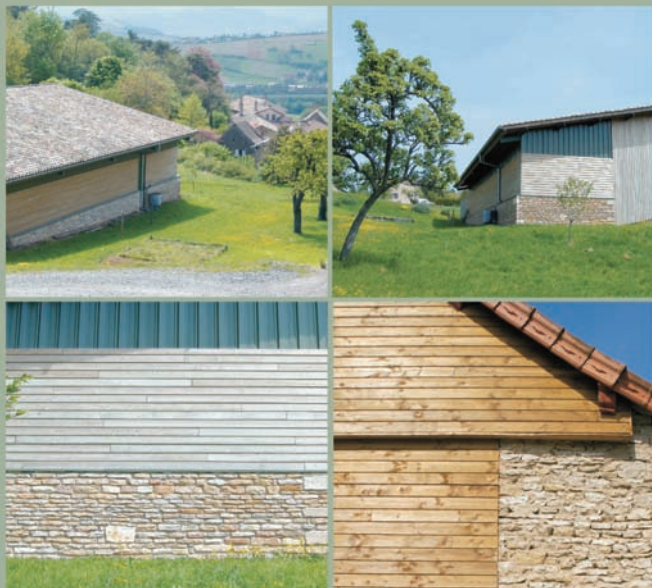
Le bois sous ses formes, abondamment utilisé dans la construction des chalets.