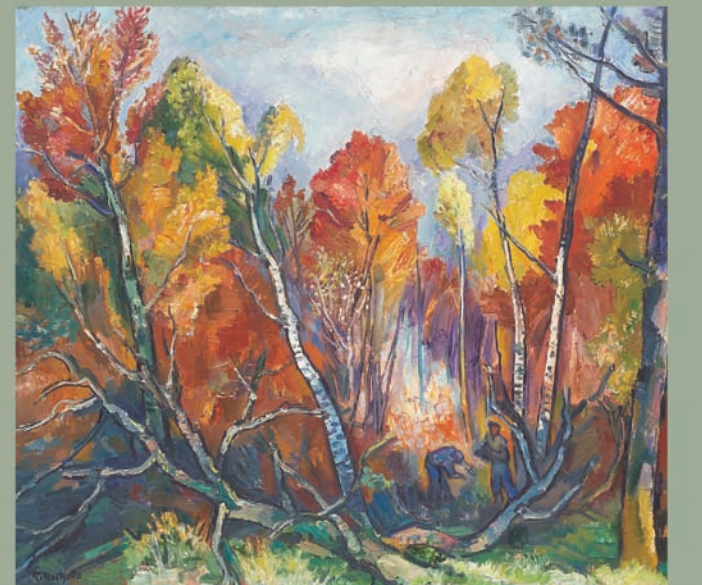
Raymond Richetto - "Saint-Jérôme-de-Bott - Forêt en automne" - "Halle sur papier, 93 x 121 cm - 1956 - Collection particulière"