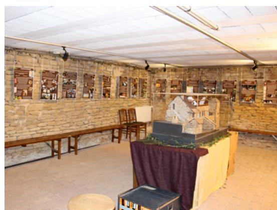
Une salle d'exposition.