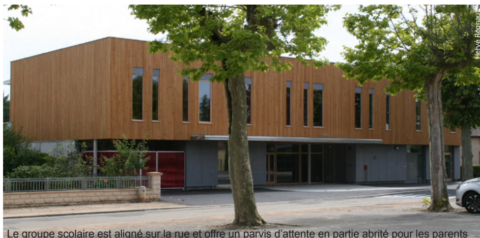
Le groupe scolaire est aligné sur la rue et offre un parvis d'attente en partie abrité pour les parents

Le groupe scolaire vu depuis l'emplacement de la future école maternelle ▼