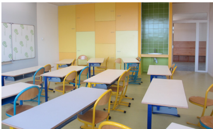
Des salles de classes très colorées ▲

permettant des jeux calmes, alors que la cour basse et son terrain multisports rendent possibles des jeux plus animés. Les salles de classes sont orientées au sud et sont protégées par une casquette. Le couloir est orienté au nord ,éclairé par des châssis allongés et colorés. Le rez-de-chaussée est une structure en béton et l'étage est une ossature bois avec des refends en béton pour assurer une inertie thermique. L'ensemble est isolé par l'extérieur. La toiture est végétalisée . L'ensemble est conçu avec beaucoup de lumière associée à des protections solaires. Le revêtement extérieur du rez-de-chaussée est constitué de panneaux bois/ciment. L'étage est recouvert d'un bardage bois vertical de type douglas. Si l'aspect extérieur est relativement sobre, les espaces intérieurs sont très colorés.