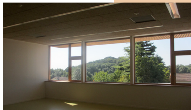
Des salles de classes ouvertes sur le paysage ▲

Texte issu de la notice architecturale fournie par le maître d'œuvre.