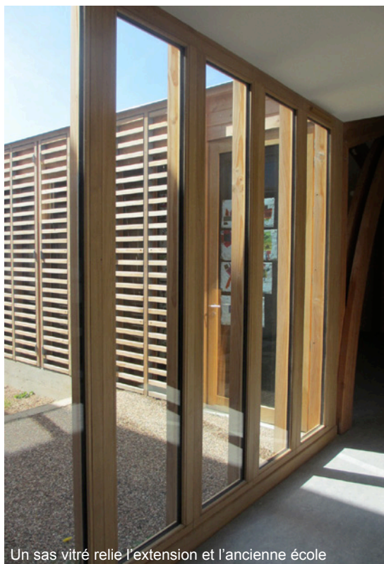
Un sas vitré relie l'extension et l'ancienne école

À l'issue de l'opération, l'école primaire dispose de deux salles de classe, dont une salle d'activités pédagogiques, réparties autour d'un hall commun situés dans une extension construite en bois local et verre. Deux autres salles de classe, des sanitaires et plusieurs pièces pour le corps enseignant et administratif occupent les locaux restaurés.