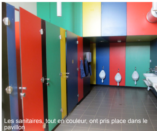
Les sanitaires, tout en couleur, ont pris place dans le pavillon