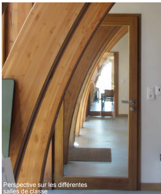
Perspective sur les différentes salles de classe

Le volume a pour objectif d'être le plus modeste possible, à la fois dans sa taille et dans sa modénature, pour ne pas troubler l'équilibre présent dans le cœur du village.