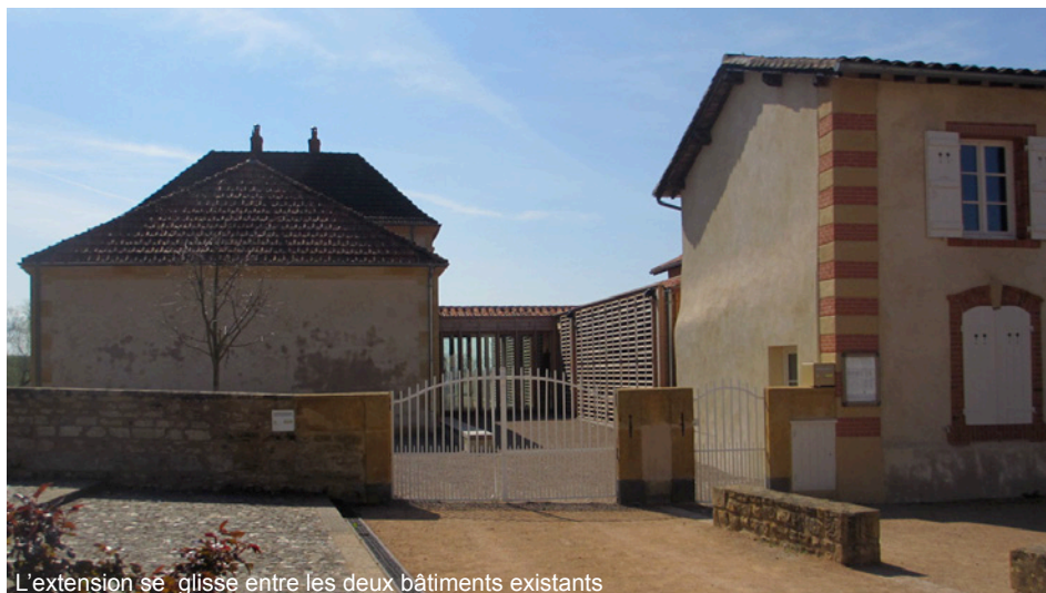
L'extension se glisse entre les deux bâtiments existants

La construction neuve vient se lover sur la nouvelle parcelle dans la continuité de la maison d'habitation, à la hauteur du socle de l'école existante.