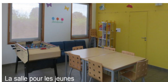
La salle pour les jeunes

La consommation énergétique estimée est de 30 à 40 kWh/m 2 /an.