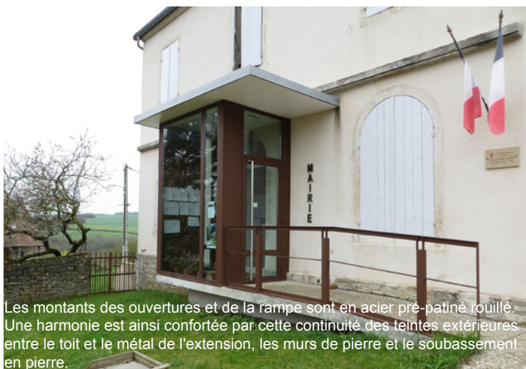
Les montants des ouvertures et de la rampe sont en acier pré-patiné rouillé. Une harmonie est ainsi confortée par cette continuité des teintes extérieures entre le toit et le métal de l'extension, les murs de pierre et le soubassement en pierre.

Afin de limiter les consommations électriques, un éclairage automatique a été mis en place. Une VMC double-flux assure le renouvellement d'air.