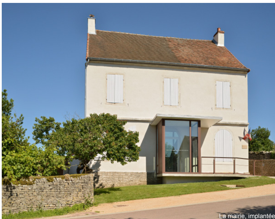
La mairie, implantée

Une petite rampe extérieure, à contre-pente, conduit à un sas thermique formant l'entrée. Des lumières, intégrées dans les montants verticaux de la main courante de la rampe, assurent un éclairage suffisant de l'entrée notamment pour la période hivernale.