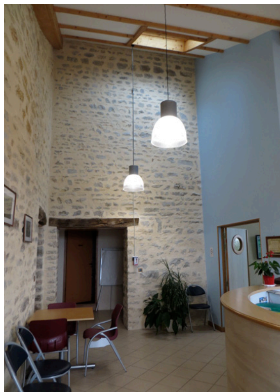
Le hall d'entrée toute hauteur.