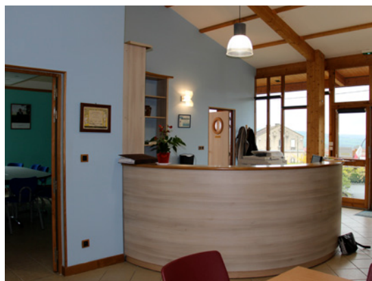
La salle du conseil municipal se glisse derrière l'accueil. Perspective vers l'extérieur depuis le cœur du bâtiment.

Le projet de mairie est implanté sur les ruines de l'ancienne grange. Il est constitué d'une (re) construction entièrement vitrée sur deux côtés, les deux autres étant fermées et en limite de propriété.