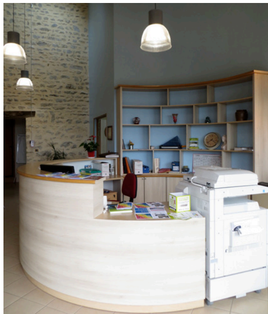
Le meuble menuisé de l'entrée.