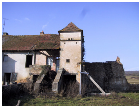
Photo avant travaux

Collonge-en-Charollais a obtenu le prix départemental de la 16 e édition des Rubans du Patrimoine en 2010, pour cette "opération Goyard". Ce prix récompense les efforts des communes rénovant, réhabilitant ou mettant en valeur leur patrimoine bâti, protégé ou non, de plus de 50 ans.