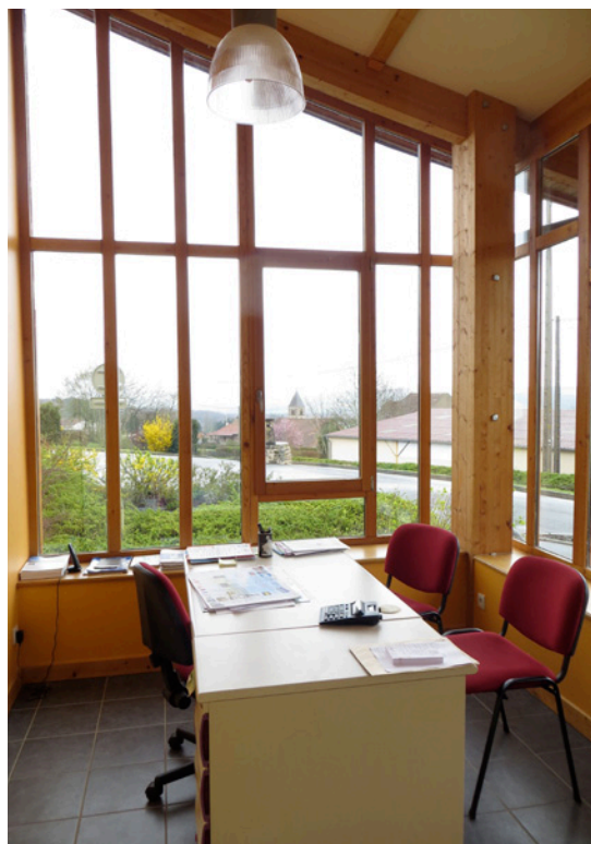
Le bureau du maire profite d'une vue dégagée sur le village.