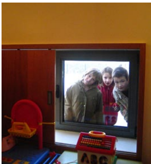
Ouverture adaptée à la taille des enfants