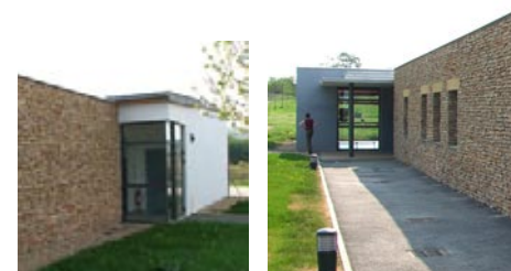
Un mur de pierre à joints creux guide enfants et parents vers l'entrée de l'école.

Les jeux de couleurs animent les différents espaces.