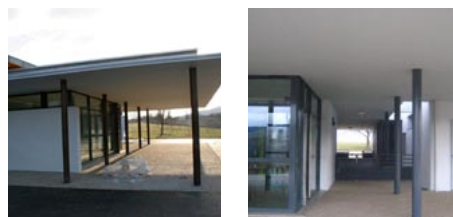
Tout en longueur, le bâtiment s'inscrit discrètement sur le haut du coteau, et s'ouvre sur le paysage des trois communes

Le bâtiment se fait très discret dans le paysage : tout en longueur, il prolonge presque «naturellement»