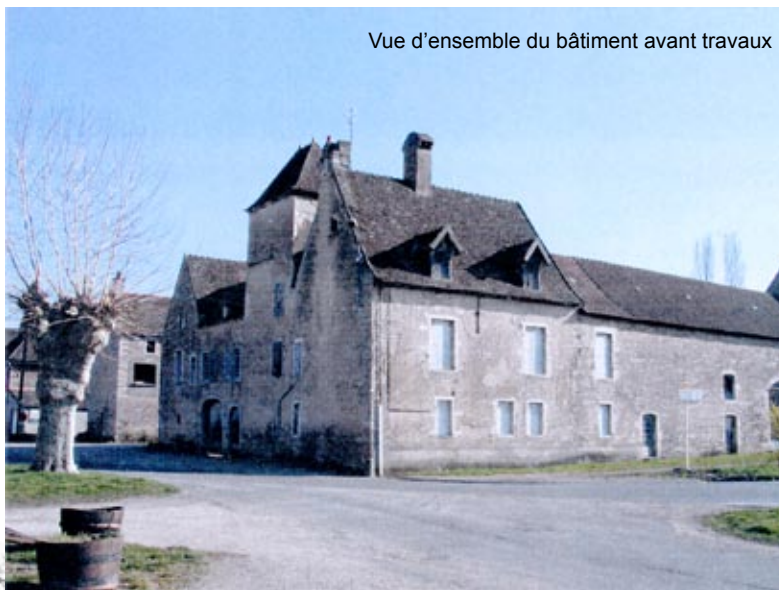
Vue d'ensemble du bâtiment avant travaux

Les travaux ont dû être échelonnés dans le temps : les première et deuxième tranches sont achevées avec la création des locaux de la mairie et les quatre logements, la troisième tranche (salles de réception) débutera au deuxième semestre 2008 et la dernière tranche (chambres d'hôtes) en 2009. Un chantier d'insertion a été mis en place avec la mission locale pour la première tranche de travaux.