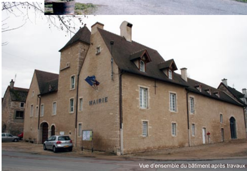
Vue d'ensemble du bâtiment après travaux